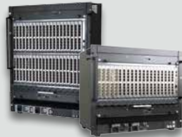
Das Draco tera Matrixsystem. Erhältlich in einem Größenspektrum von 8 bis 576 Ports.